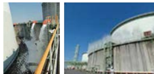
LNGタンクの防液堤に設置している高発泡設備および水幕設備

これらのタンクには、高度な耐震技術を採用しています。また、防液堤を設け、万一LNGがもれ出しても外部に流出しない構造としています。さらに、防液堤内に流れ出た場合にLNGの拡散や火災の影響を防ぐため、大量の泡を放出する高発泡設備と、水幕をスクリーン状に形成する水幕設備を設置しています。