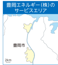
供給区域：兵庫県豊岡市