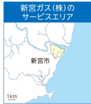
供給区域：和歌山県新宮市