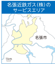
供給区域：三重県名張市