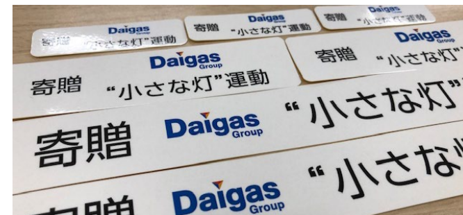
寄贈品にシールを貼付し、寄付を見える化